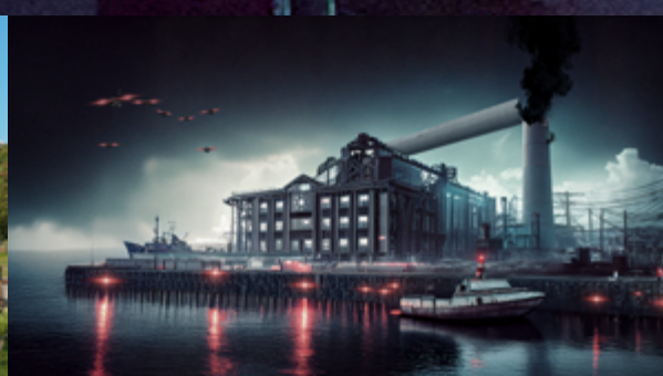
Usina do Gasômetro