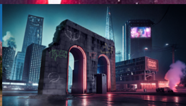
Arco da Redenção