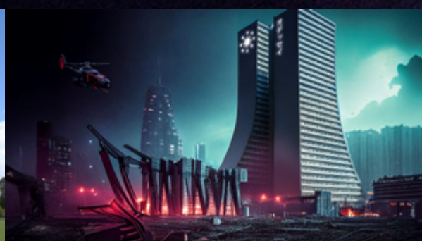
Centro Administrativo Fernando Ferrari